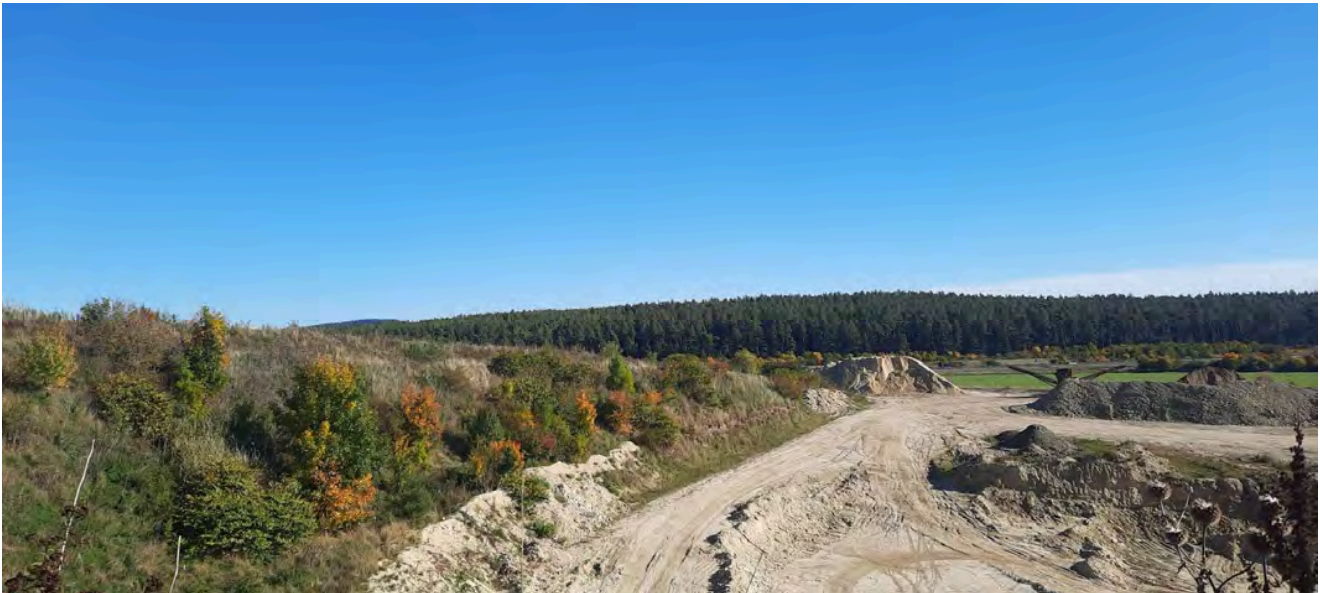
Bilder oben und links: Sandgrube bei Neuroda