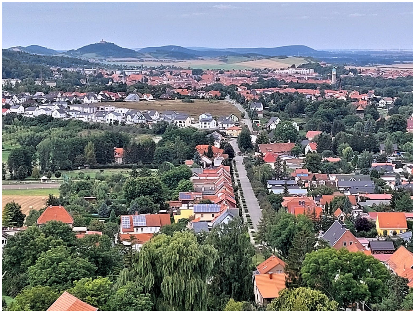
Blick von der Käfernburg über Arnstadt